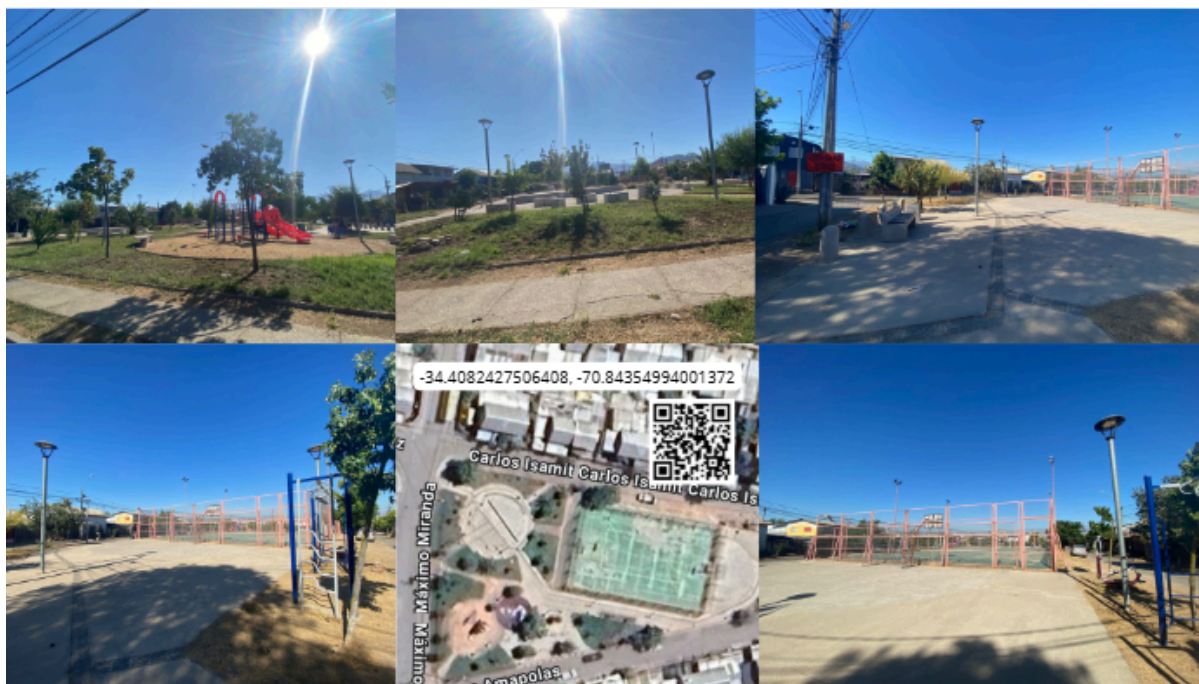
Imagen N° 45