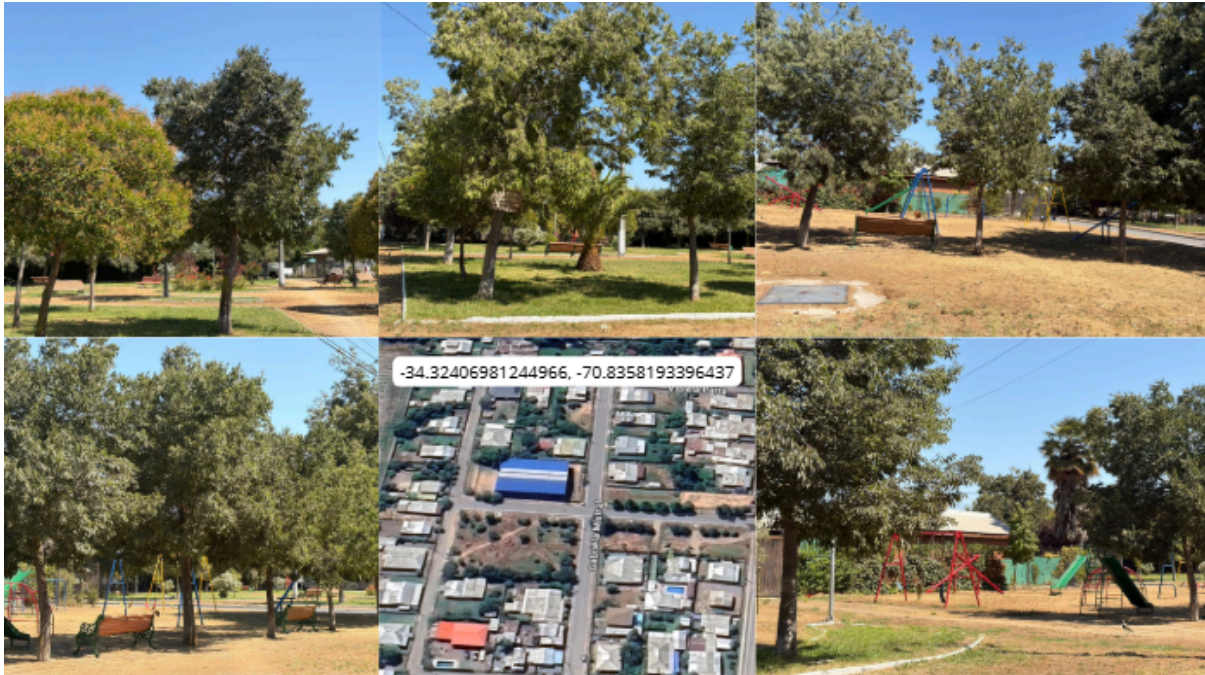
Imagen N° 47