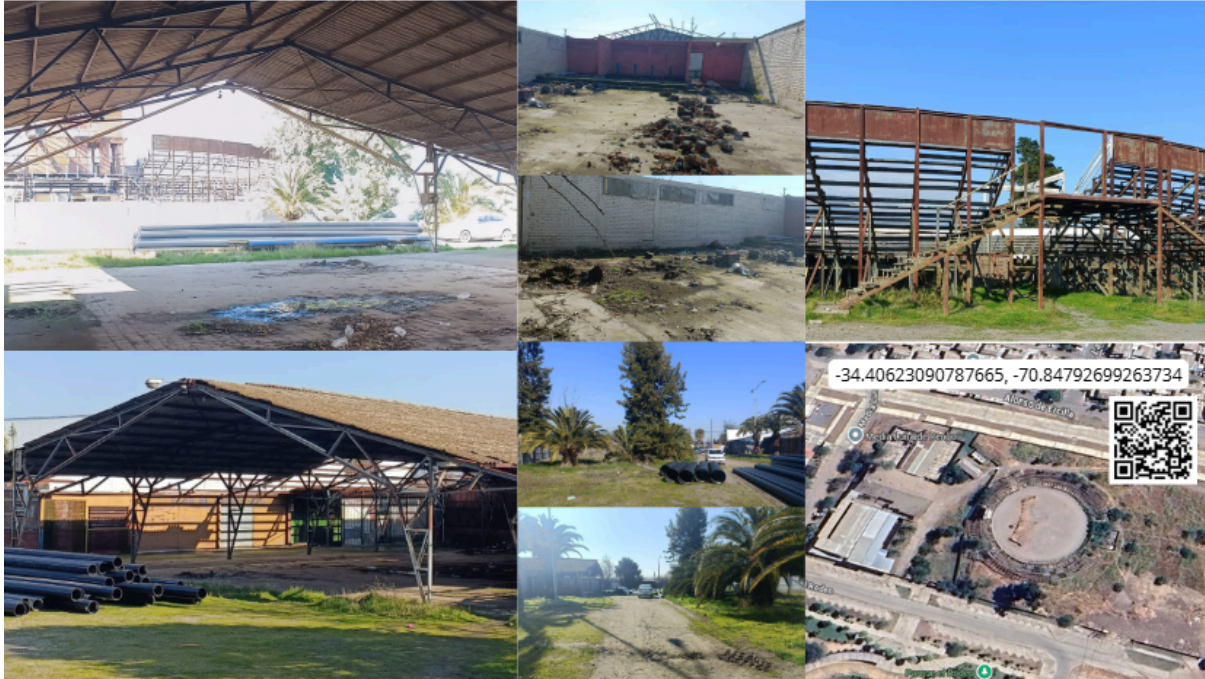
Imagen N° 63