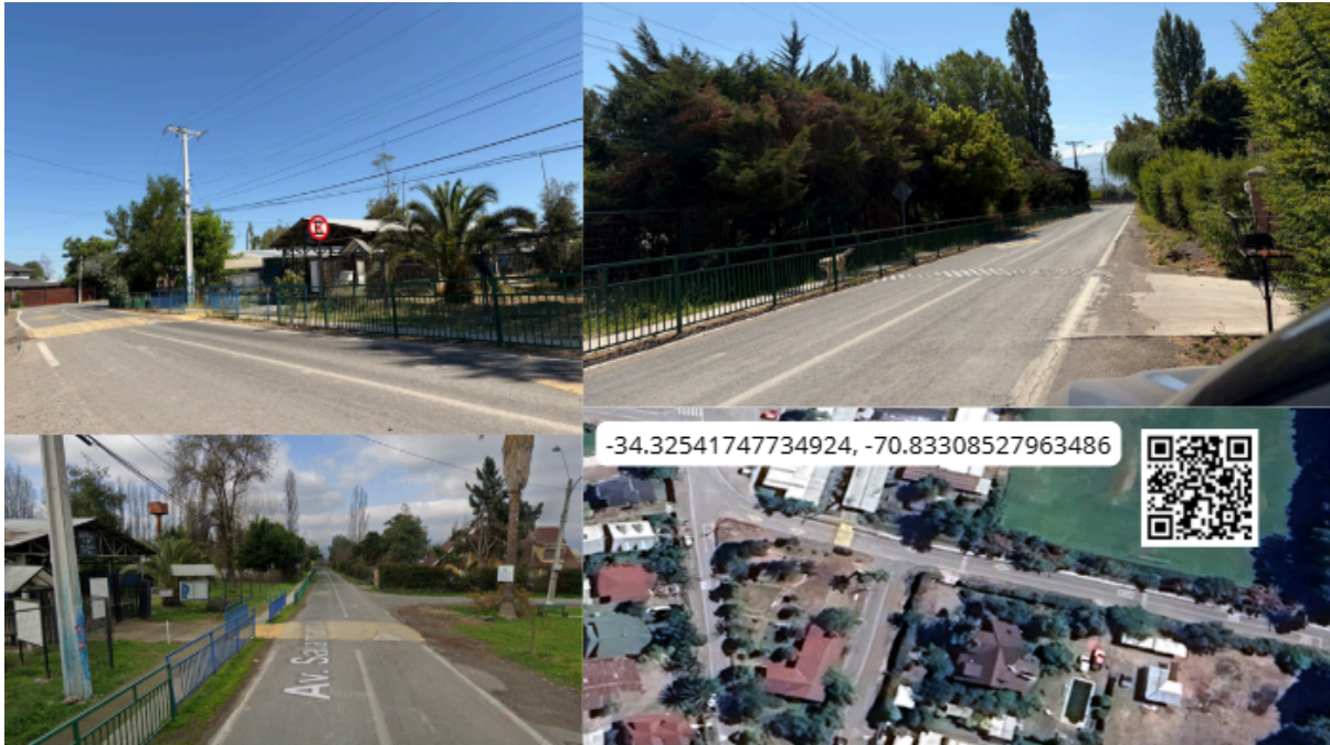
Imagen N° 31