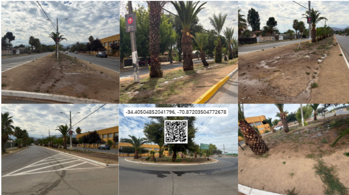
Imagen N° 55