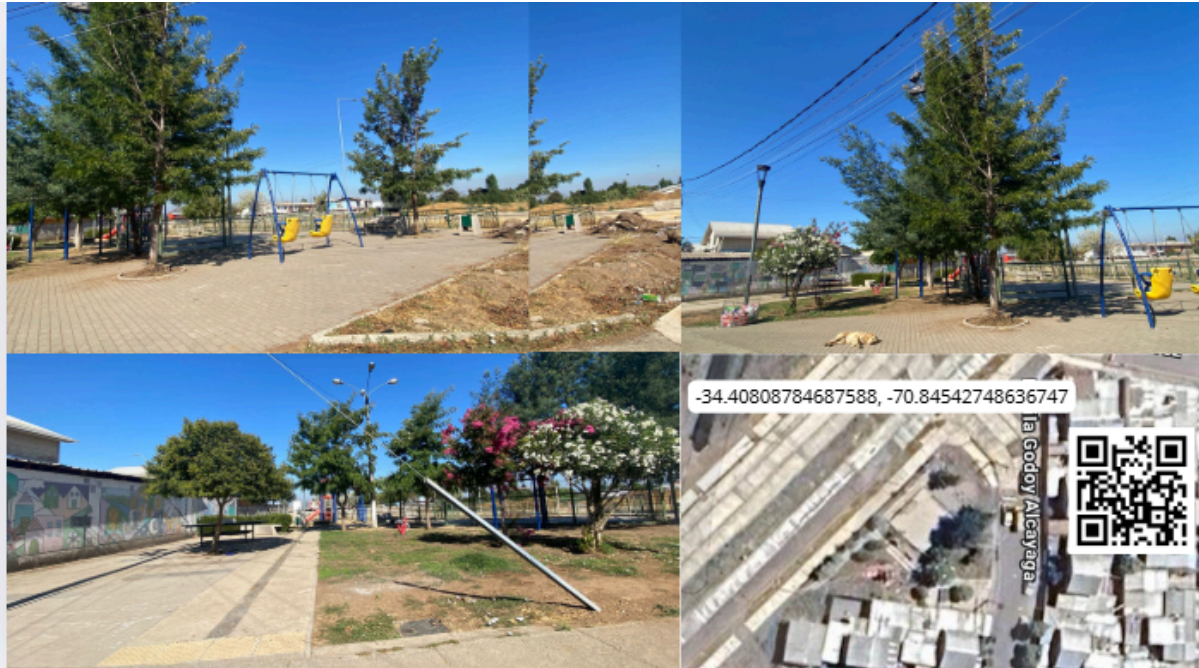
Imagen N° 44