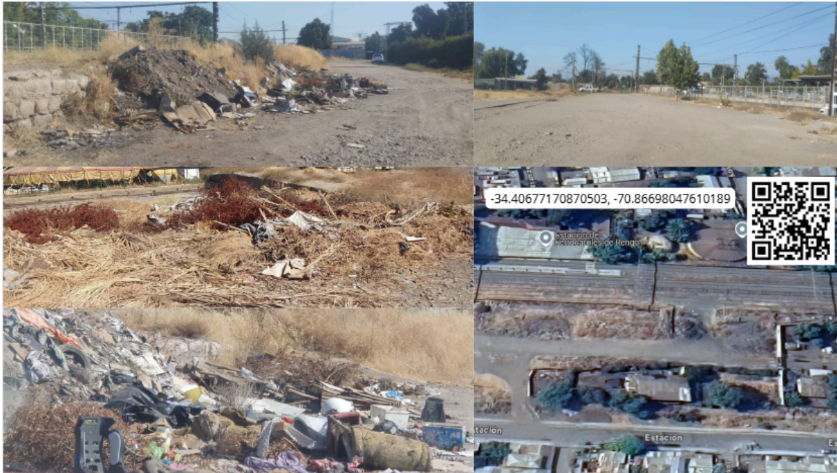
Imagen N° 64