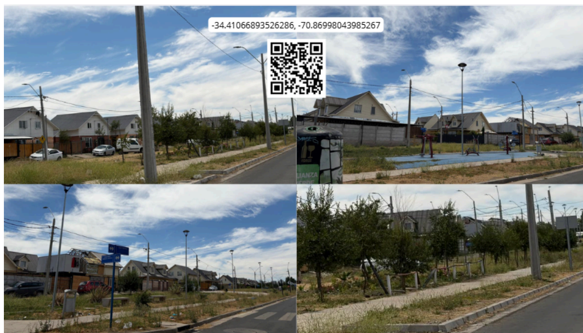
Imagen N° 59