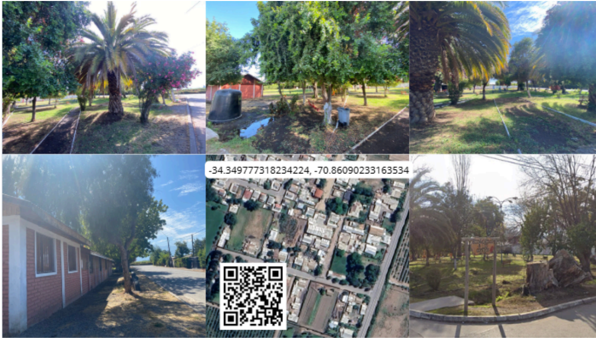
Imagen N° 51