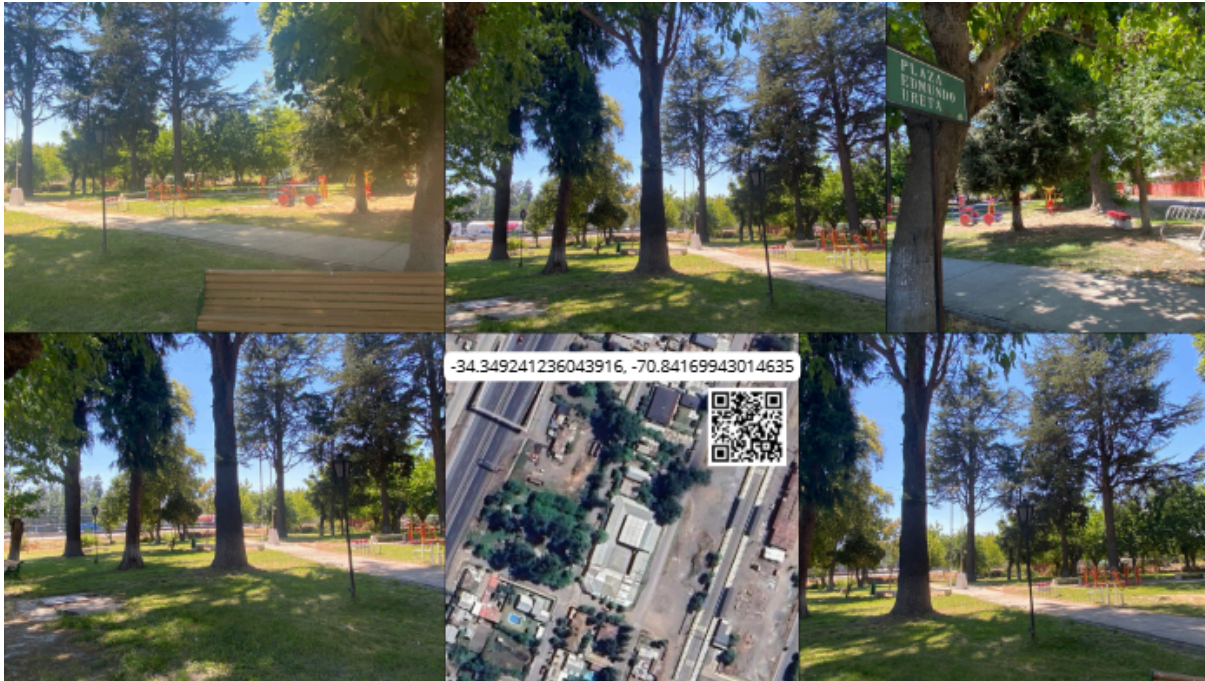
Imagen N° 34