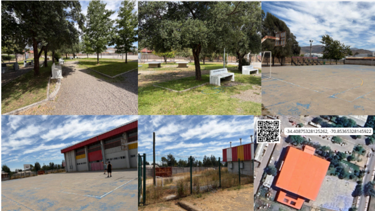
Imagen N° 42