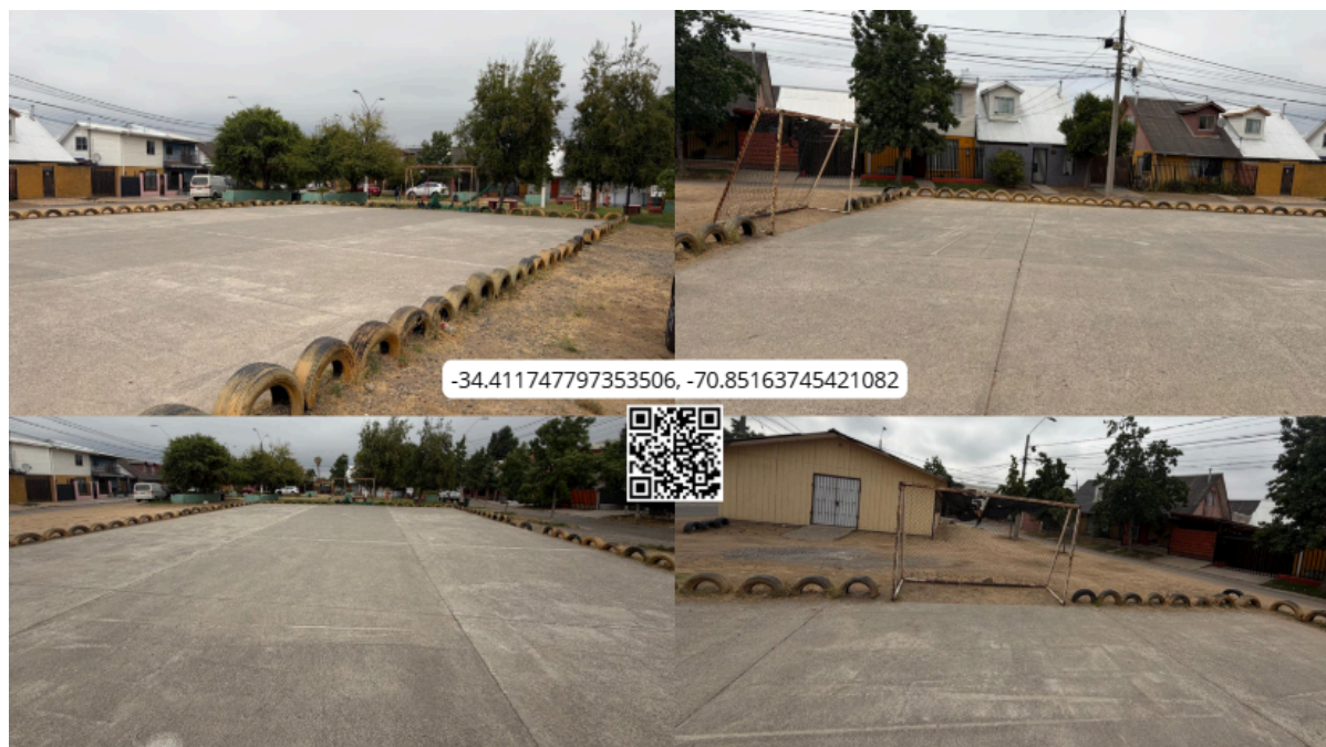
Imagen N° 52