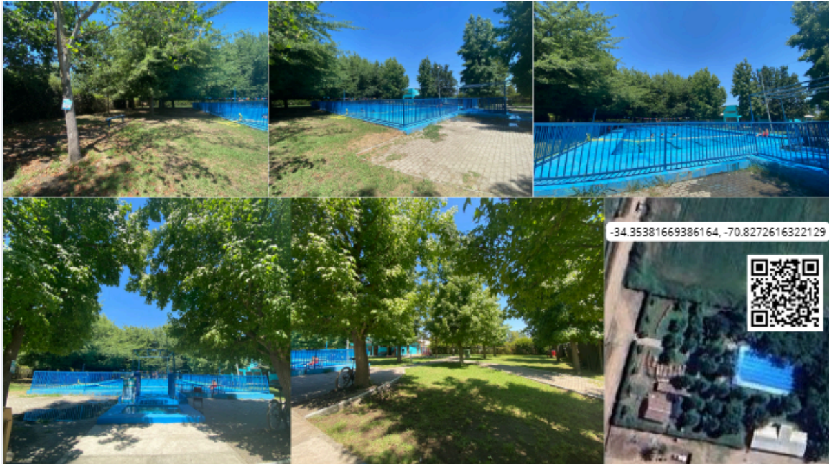
Imagen N° 48