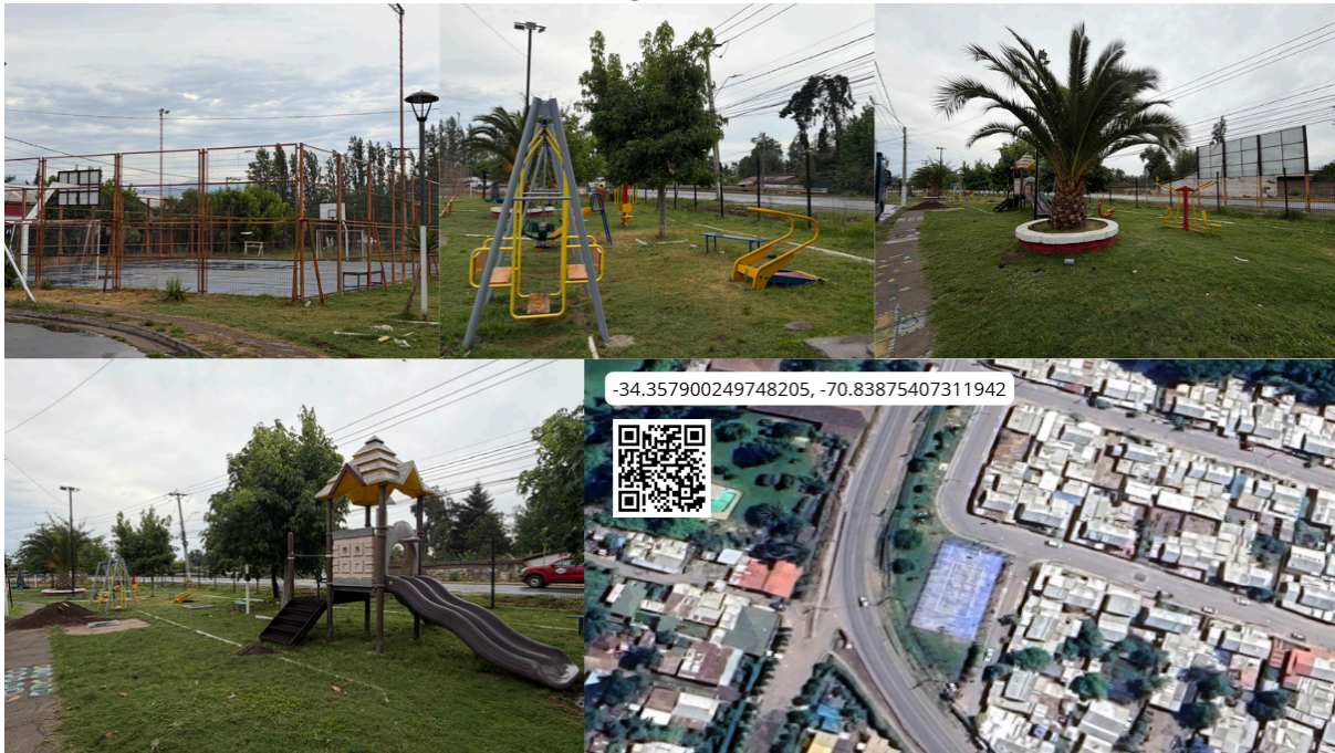
Imagen N° 62