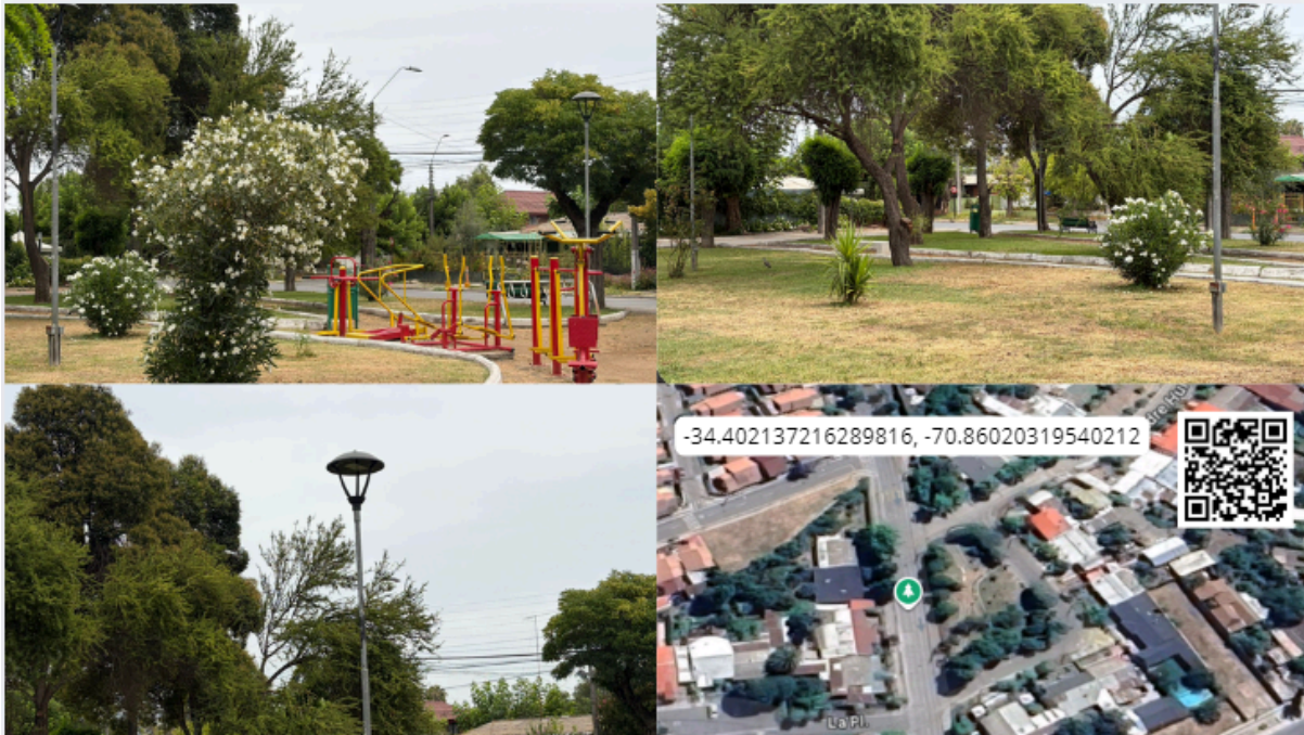
Imagen N° 25