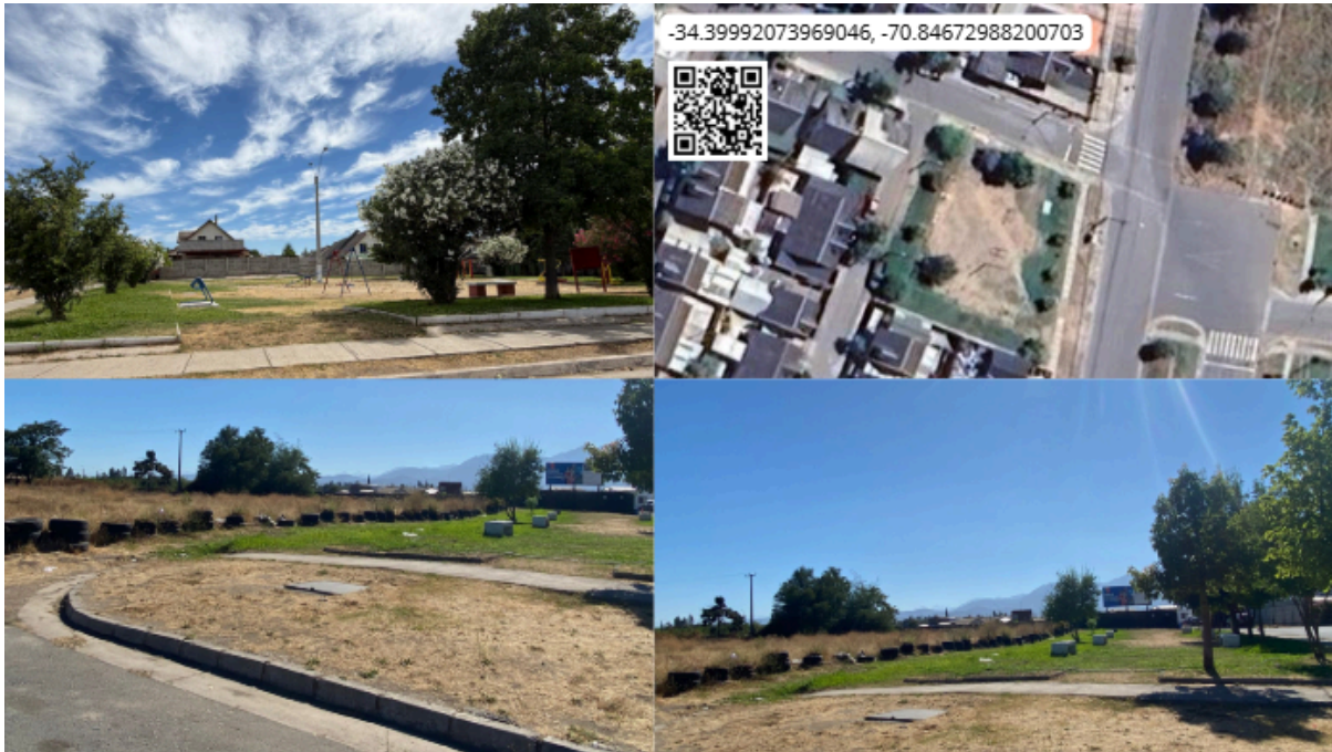
Imagen N° 43