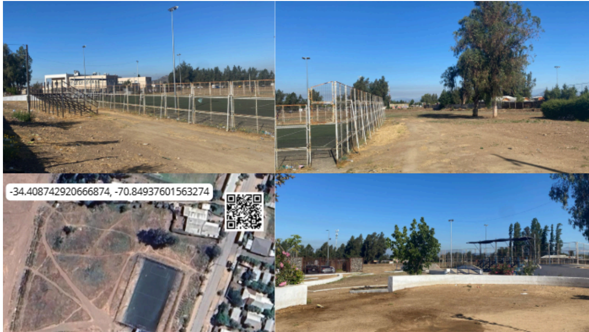
Imagen N° 37