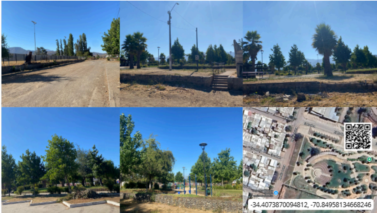
Imagen N° 39