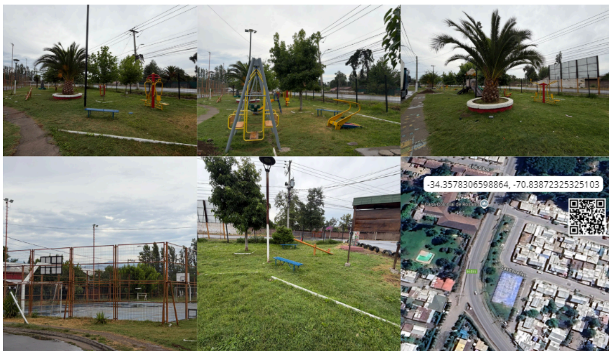
Imagen N° 24