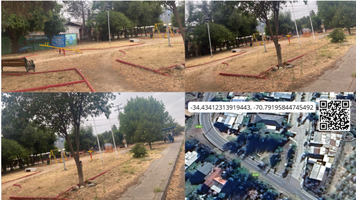
Imagen N° 21