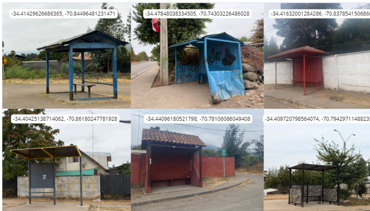
Imagen N° 20