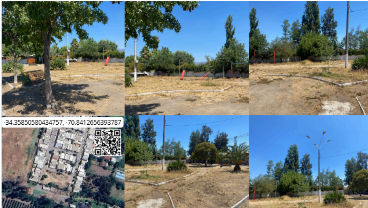
Imagen N° 36