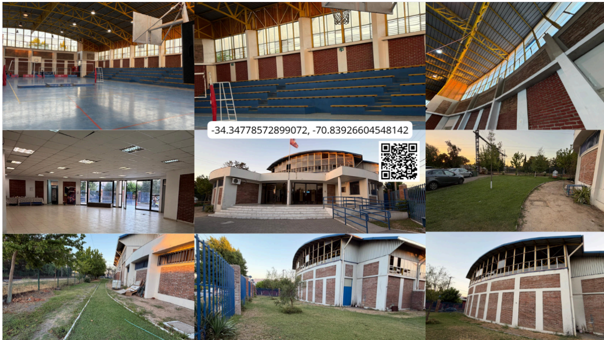
Imagen N° 54