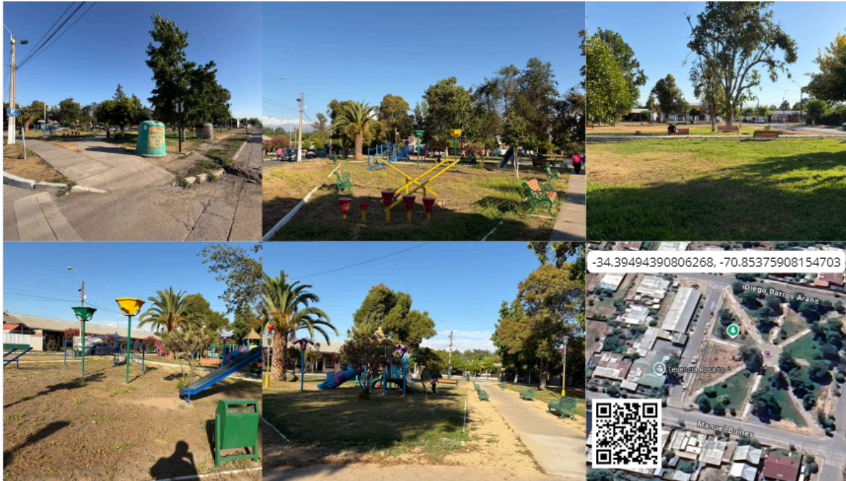
Imagen N° 29