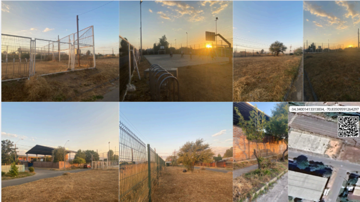
Imagen N° 32