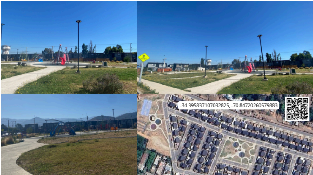
Imagen N° 40