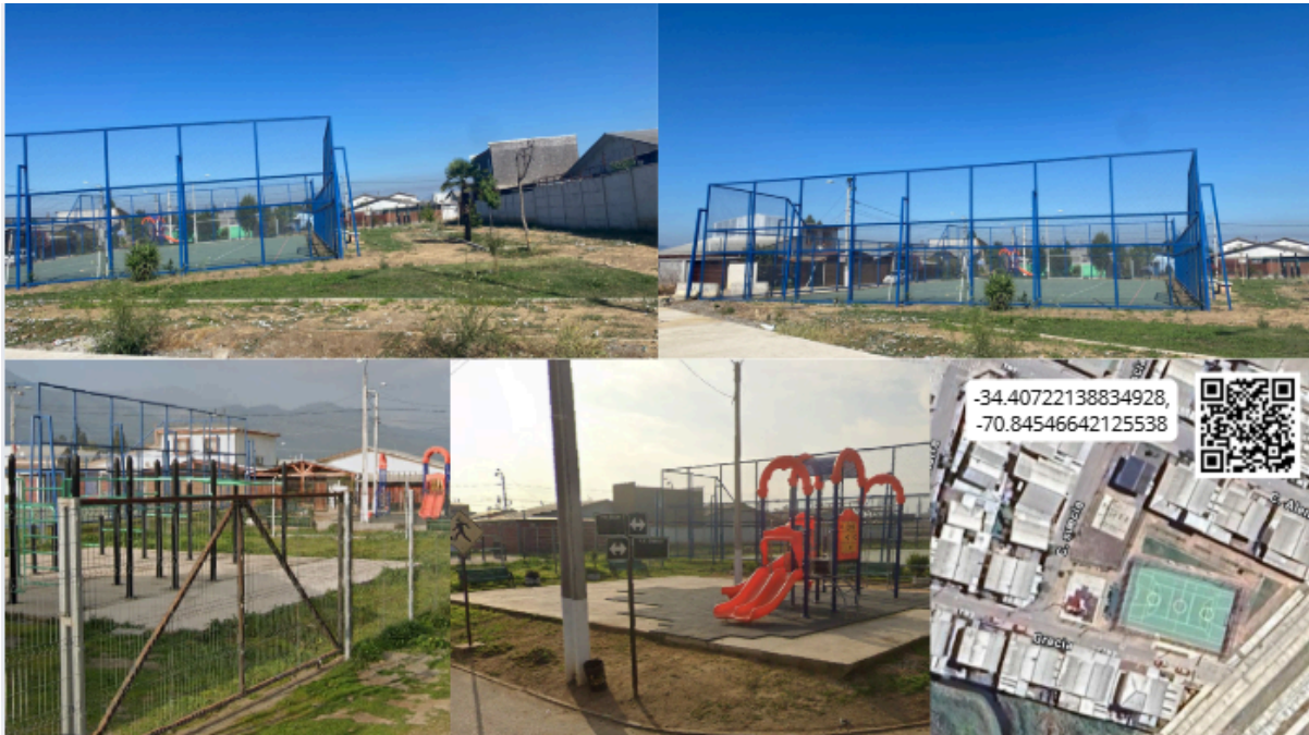
Imagen N° 41