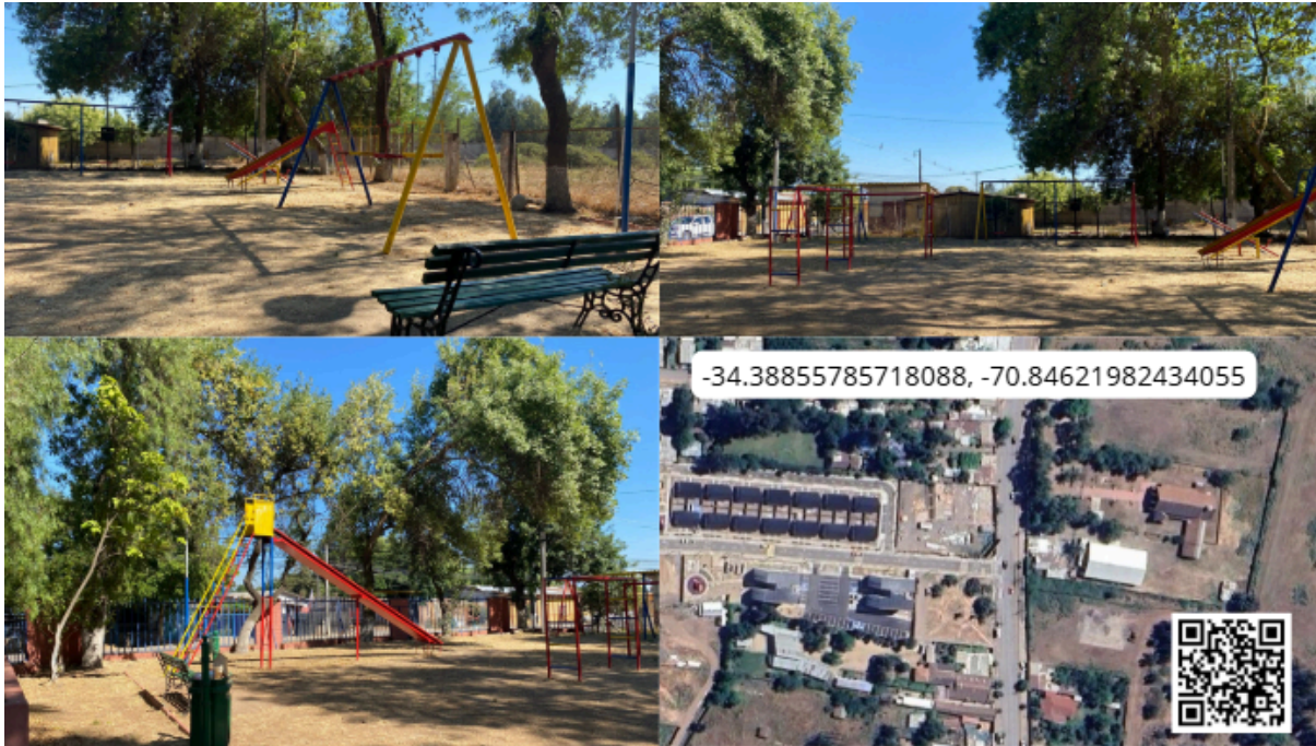
Imagen N° 33