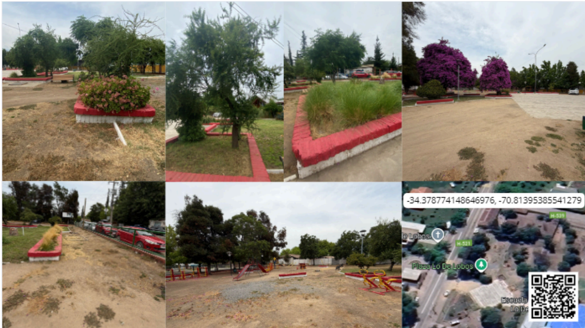
Imagen N° 27