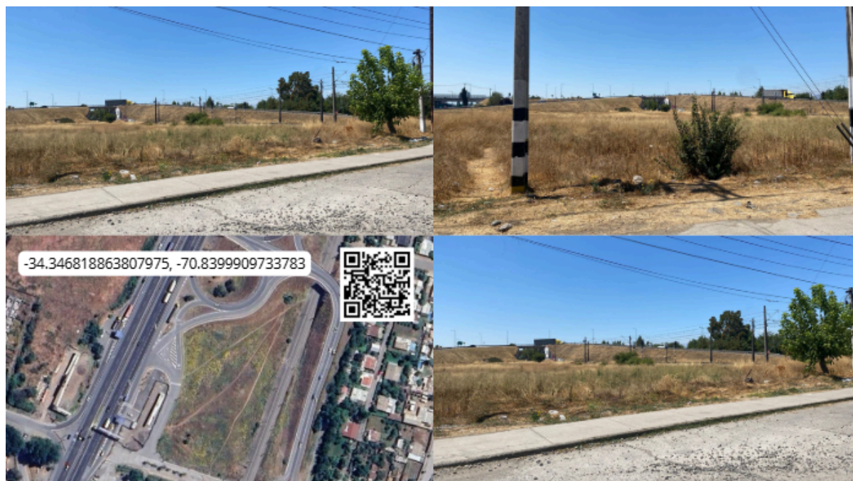
Imagen N° 35