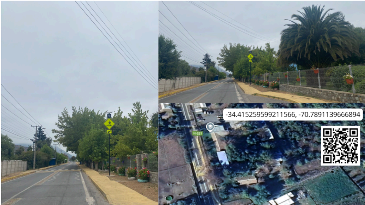
Imagen N° 23