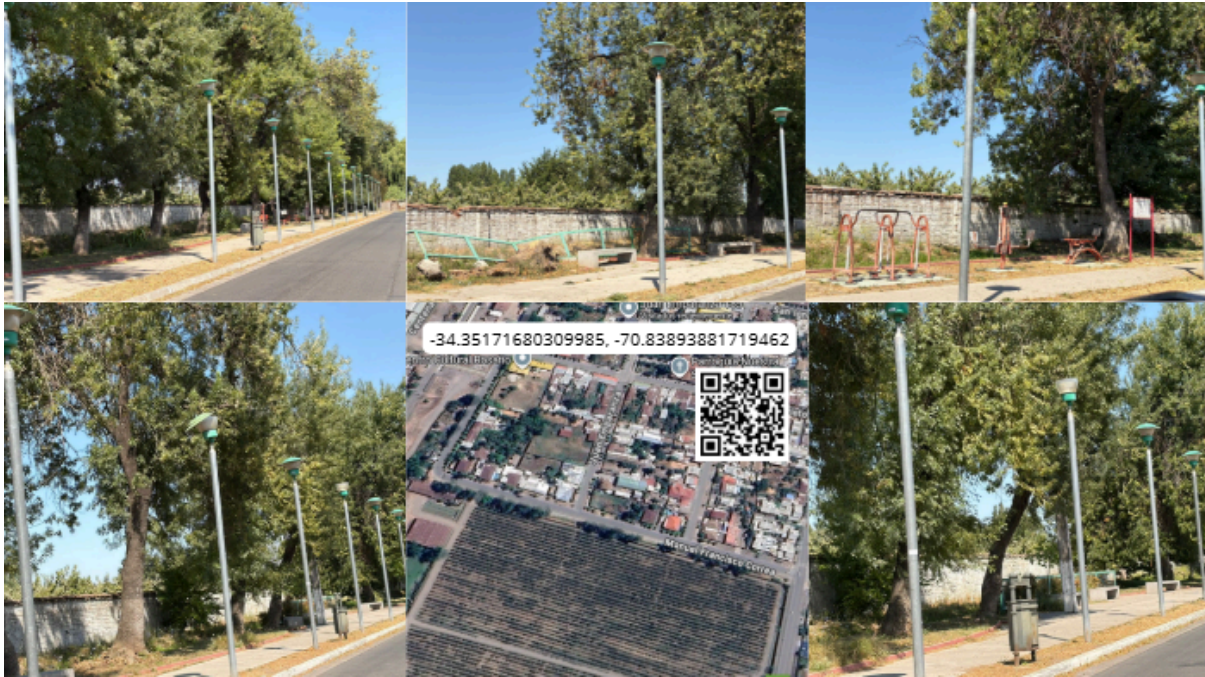
Imagen N° 46