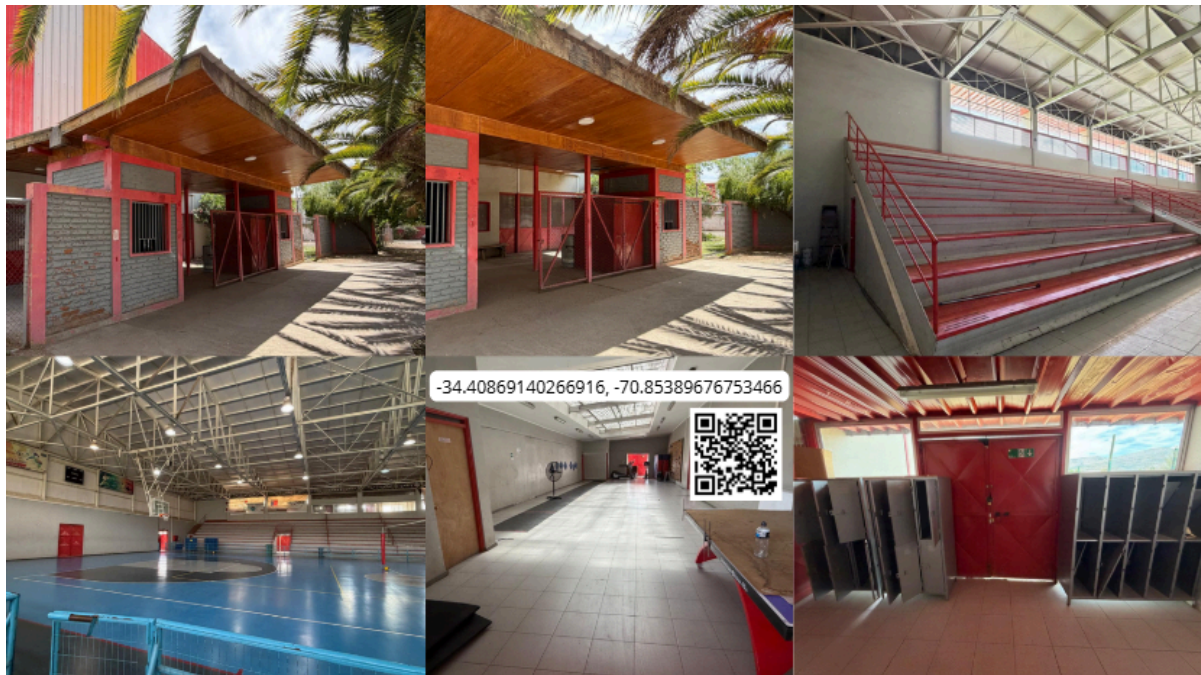
Imagen N° 56