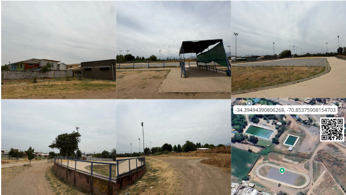
Imagen N° 28