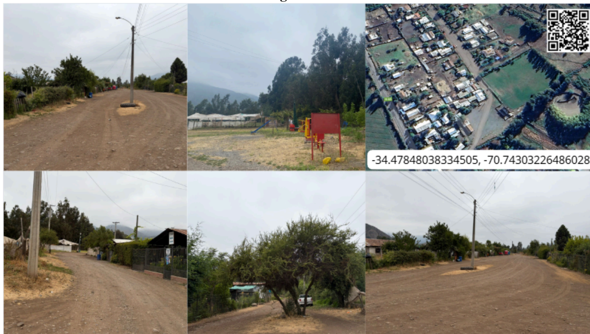
Imagen N° 22