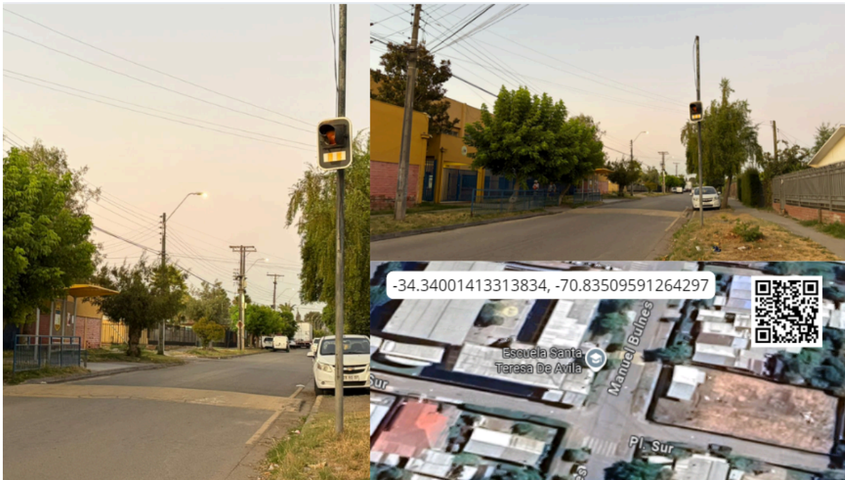
Imagen N° 30