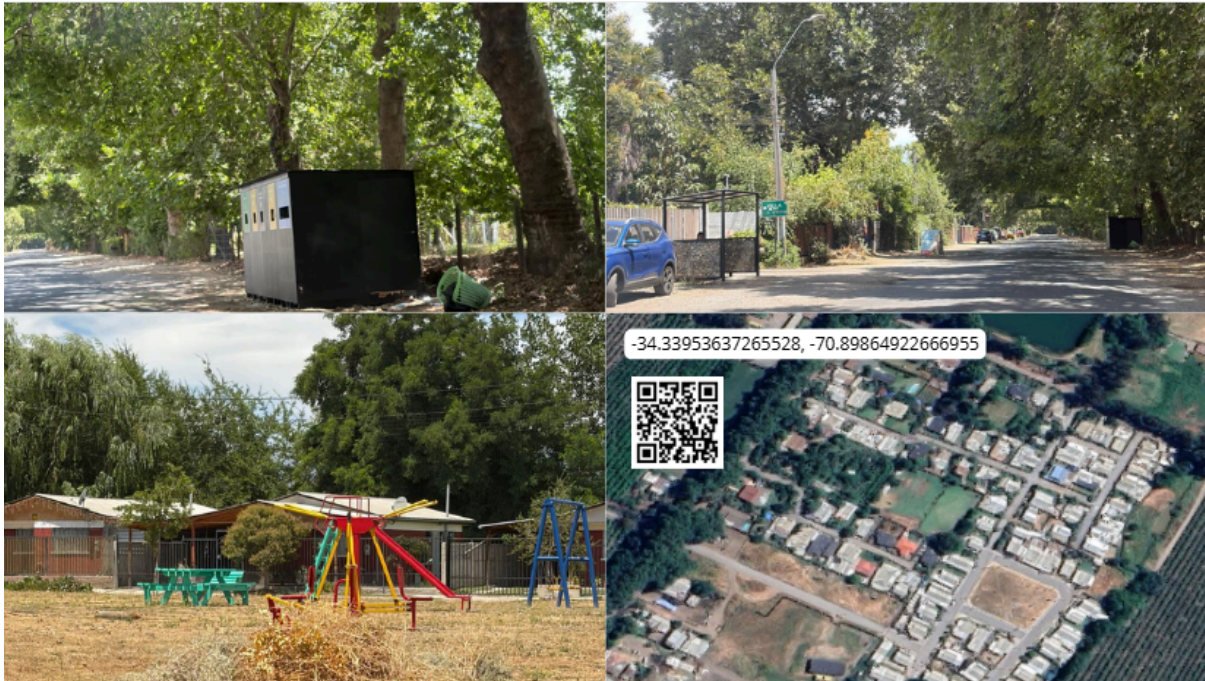
Imagen N° 61