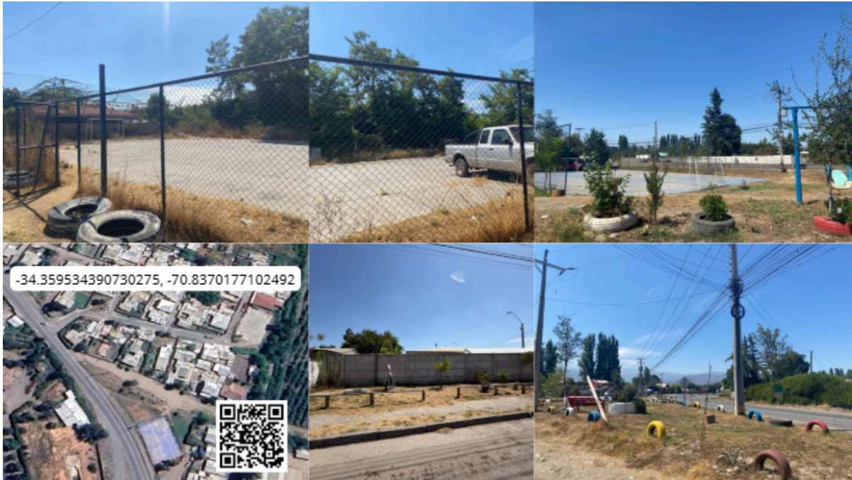
Imagen N° 50