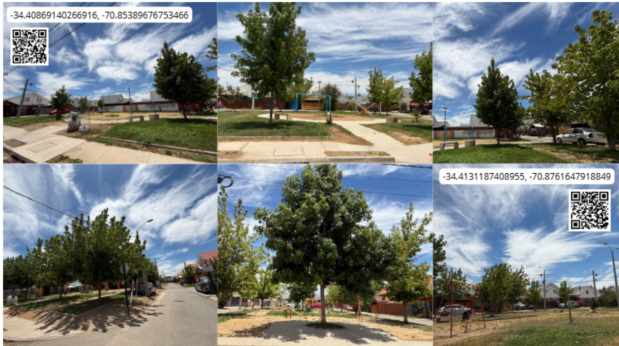
Imagen N° 57