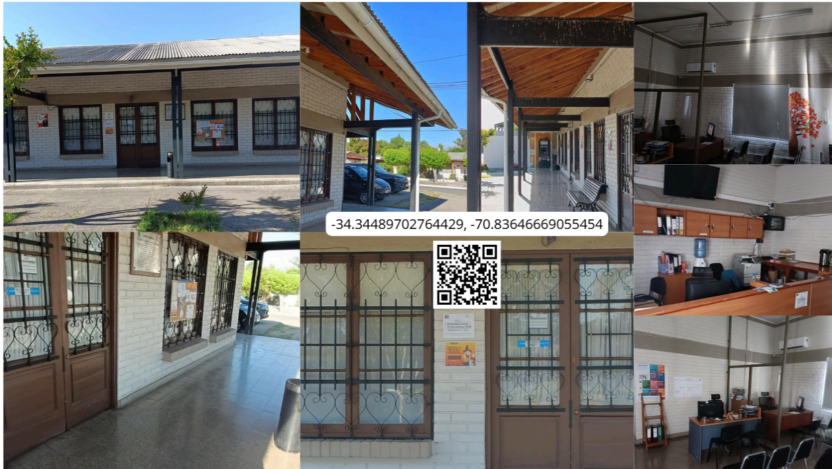
Imagen N° 53