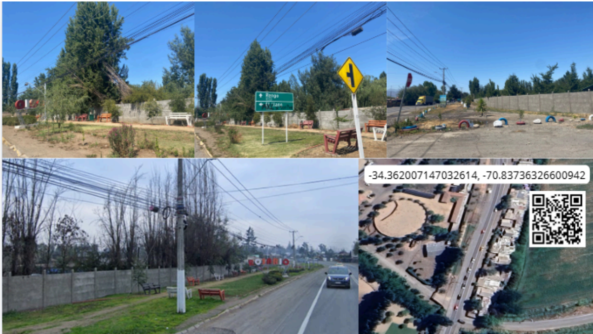
Imagen N° 49