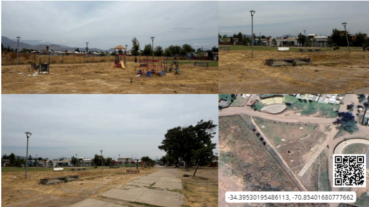
Imagen N° 26