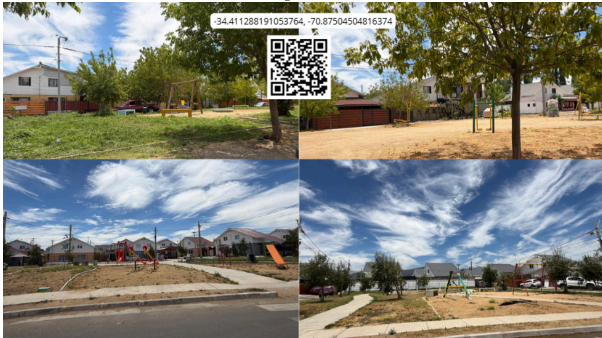
Imagen N° 58