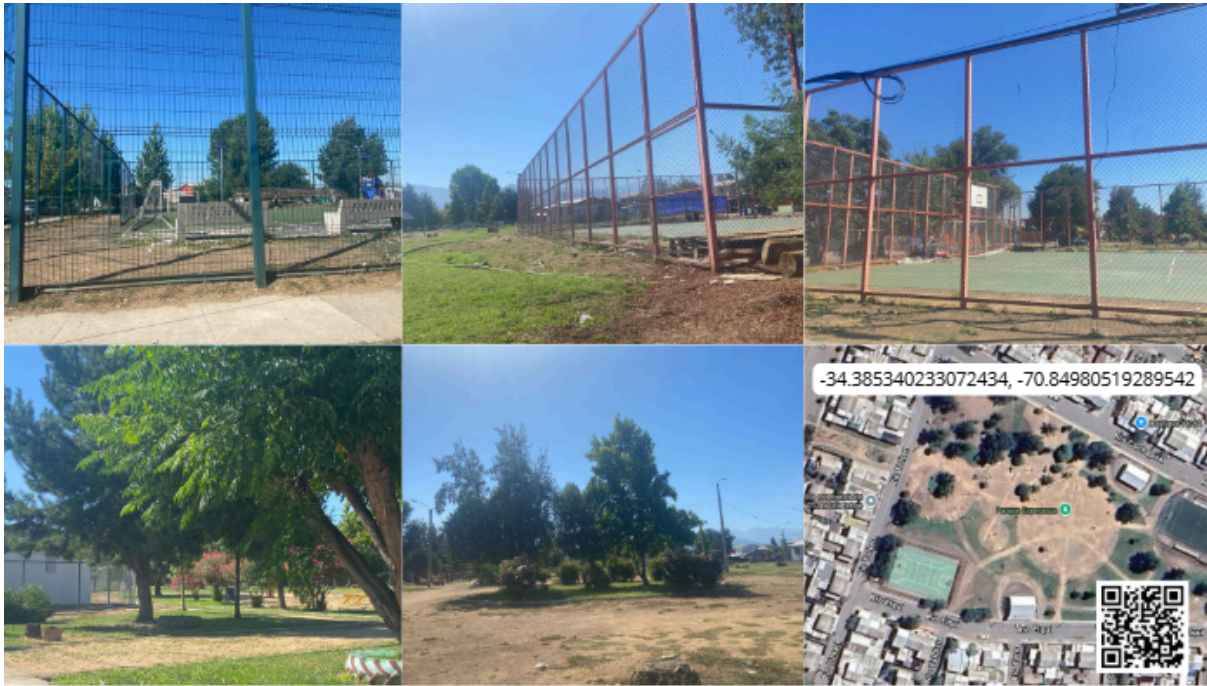
Imagen N° 38