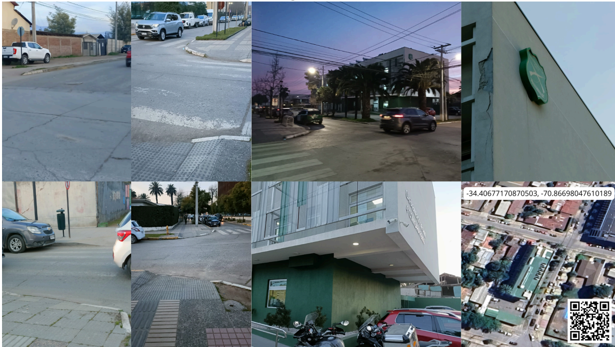
Imagen N° 65